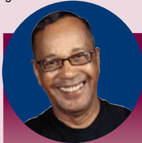
Usted visita a su médico

Sacar provecho de su HRA es fácil. Cada vez que incurra en un gasto elegible y tenga dinero en su cuenta, se le reembolsará por el gasto.