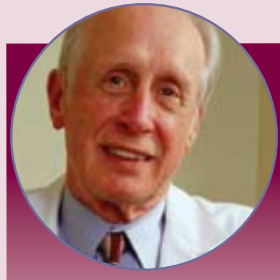
Su médico nos envía la reclamación